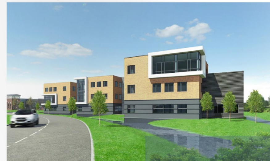
Een familie van drie

De kracht van het ontwerp ligt in de ogenschijnlijke eenvoud. Van Es Architecten koos voor een duidelijke, voor zichzelf sprekende opbouw waarin neu-