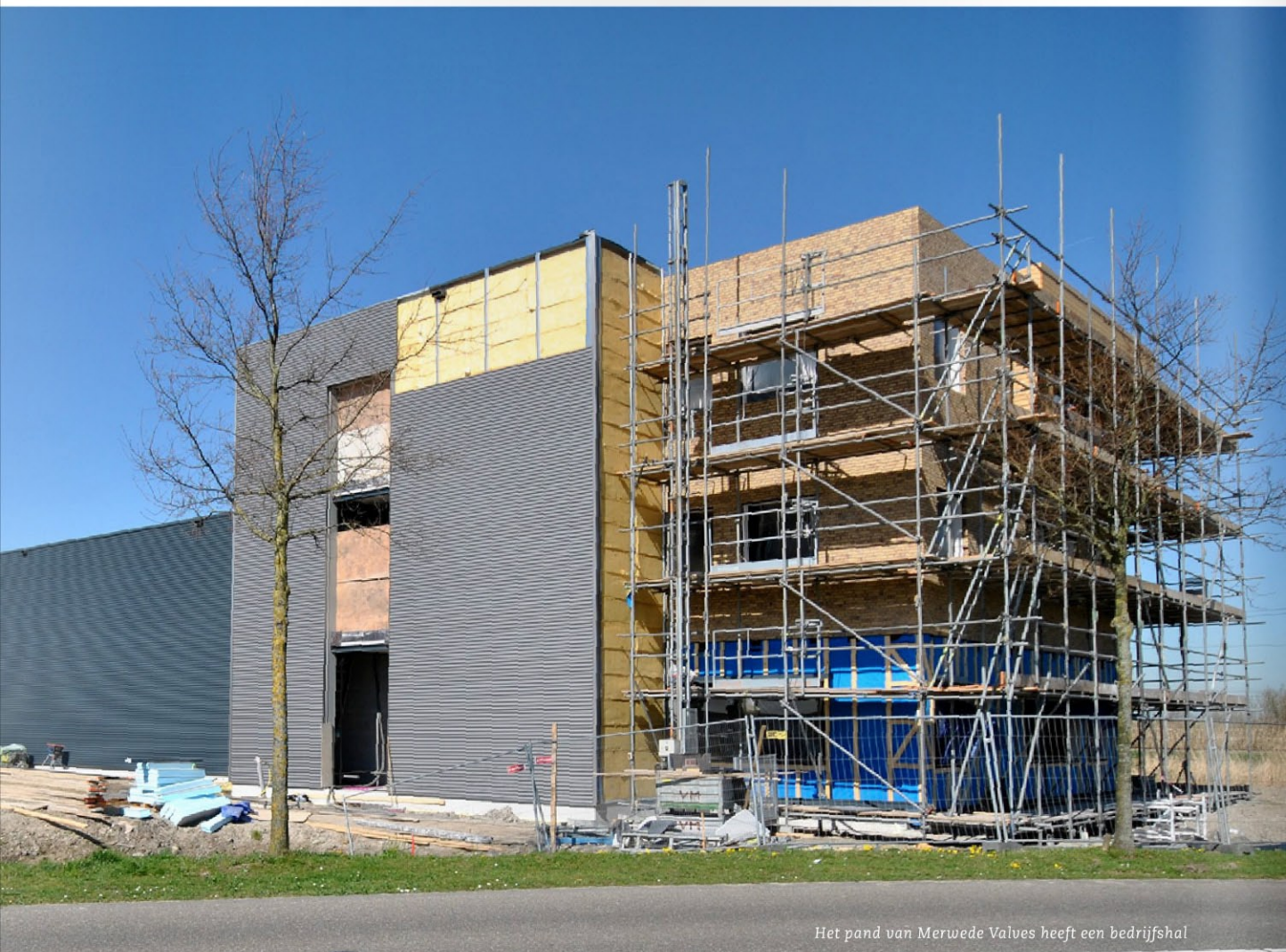
Het pand van Merwede Valves heeft een bedrijfshal