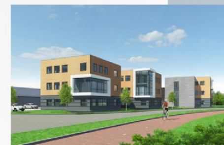
Duidelijk herkenbaar als familie